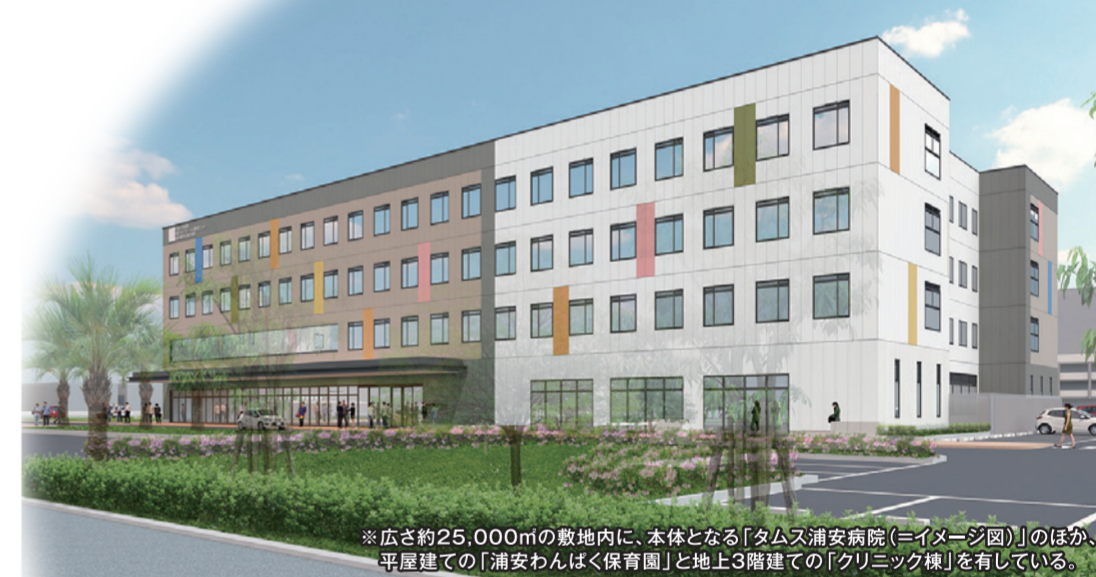
※広さ約25,000mの敷地内に、本体となる「タムス浦安病院(三イマービル)」のほか、平屋建ての「浦安わんぱく保育園」と地上3階建ての「クリニック棟」を有している。